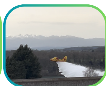
Passage des canadiens au-dessus du Lac du Gabas