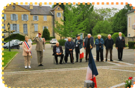
La cérémonie du 8 mai