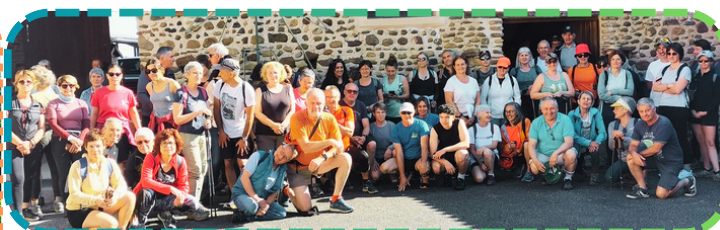
La marche organisée par l'AFDI