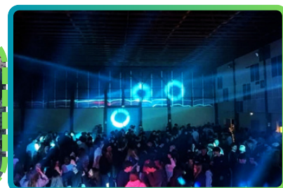
Le bal du comité des fêtes