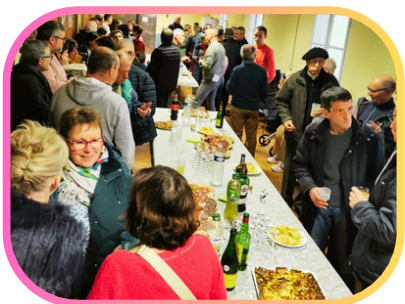
La cérémonie des vœux 2025