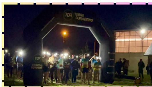
Le trail nocturne du téléthon